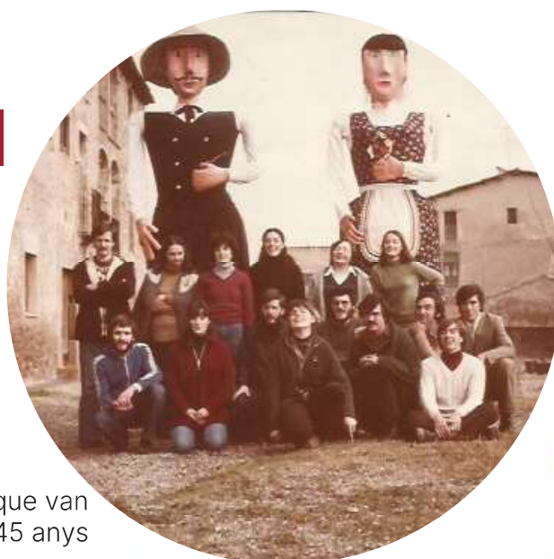
Colla de Cabrianes que van construir els gegants ara fa 45 anys

que ens hi posarà la música i les colles geganteres de Callús, d'Esparreguera, de Monistrol de Montserrat, de Ribes de Freser, Els K + sonen de Balsareny, de Fonollosa i els gegants i gegantons de Cabrianes