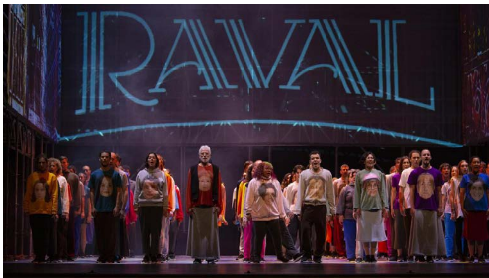
La gata perduda , d'Arnau Tordera i Victoria Szpunberg. Gran Teatre del Liceu, 2022.

El vostre text ha de tenir entre dues-centes i dues-centes cinquanta paraules.